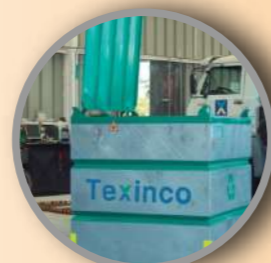
Cerrado galvanizado 2m 3