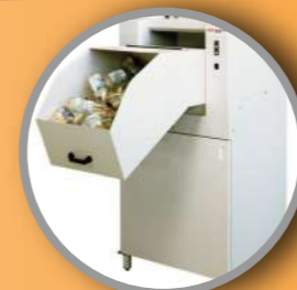
Destrozador de plástico para botellas PET