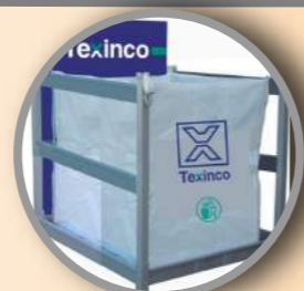
Porta Big Bag