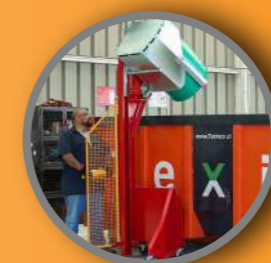
Basculador eléctrico solar