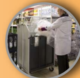
Enfardadora para film stretch