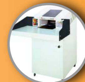
Trituradora de papeles