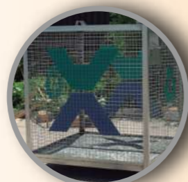
Contenedor malla 2m 3