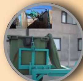
Volteador para grúa horquilla