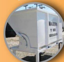
Volteador 2,5 m 3