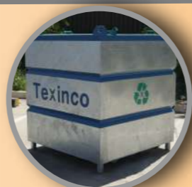
Contenedor galvanizado 2m 3